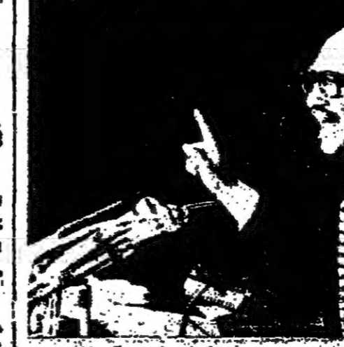
الرئيس المصري محمد انور السادات

وقال الرئيس السادات في الخطاب الذي القاها امس امام مجلس الشعب المصري بمناسبة ذكرى المولد النبوي الشريف ان الزميل محمد « عليه الصلوة والسلام » ضرب لنا القدوة والمثل وحده لنا معالم الطريق ، وانا ما دينا على حق فلا بد ان